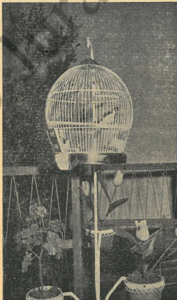
Rincón de la Exposición Ibérica. En la jaula un "cardenal" del Brasil.

gunos pájaros resultan notas deliciosas para el oído del aficionado. Todo esto se está consiguiendo con tesón y sacri-