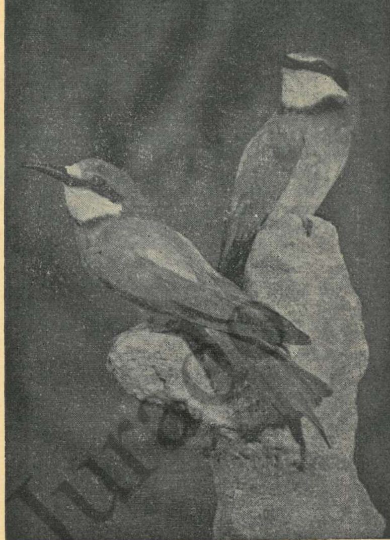
Una pareja de abejarucos. (Museo de Historia Natural del Colegio de San José. Valencia.)

Luego tomé otro ejemplar y repetía la misma experiencia andariega. Al tomar la hembra y dejarla en el suelo, se quedó parada y después empezó a andar de lado y rápidamente a reculones, y dando los acostumbrados saltitos, como