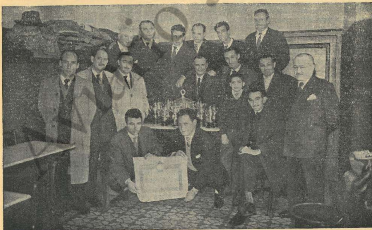
Del Concurso de León. Grupo de algunos concursantes que obtuvieron premio.

MADRID. —Actualmente se procede a la reorganización del Grupo Provincial mediante la oportuna revisión del censo de afiliados del mismo. Han sido designados veinte enlaces de zona, uno por cada una de las divisiones territoriales que se ha hecho de la capital, para poder mejor mantener el enlace entre los agrupados.