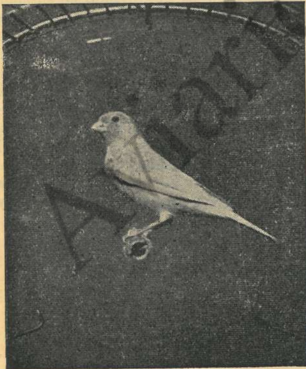
Bella fotografía de canario.

En música, metálico, se dice para nombrar lo agudo, lo estridente, por lo que no nos explicamos aquel cambio.